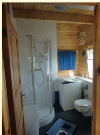
Bad mit Dusche, WC und Waschmaschine